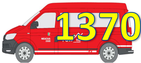
Indicatif ``ECAP 1370``